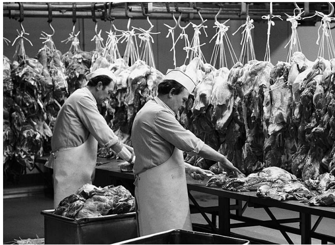
Eine Branche mit vielen Leiharbeitern: Fleischverarbeitung

Die Lohnkonkurrenz durch billigere Arbeitskräfte aus Polen